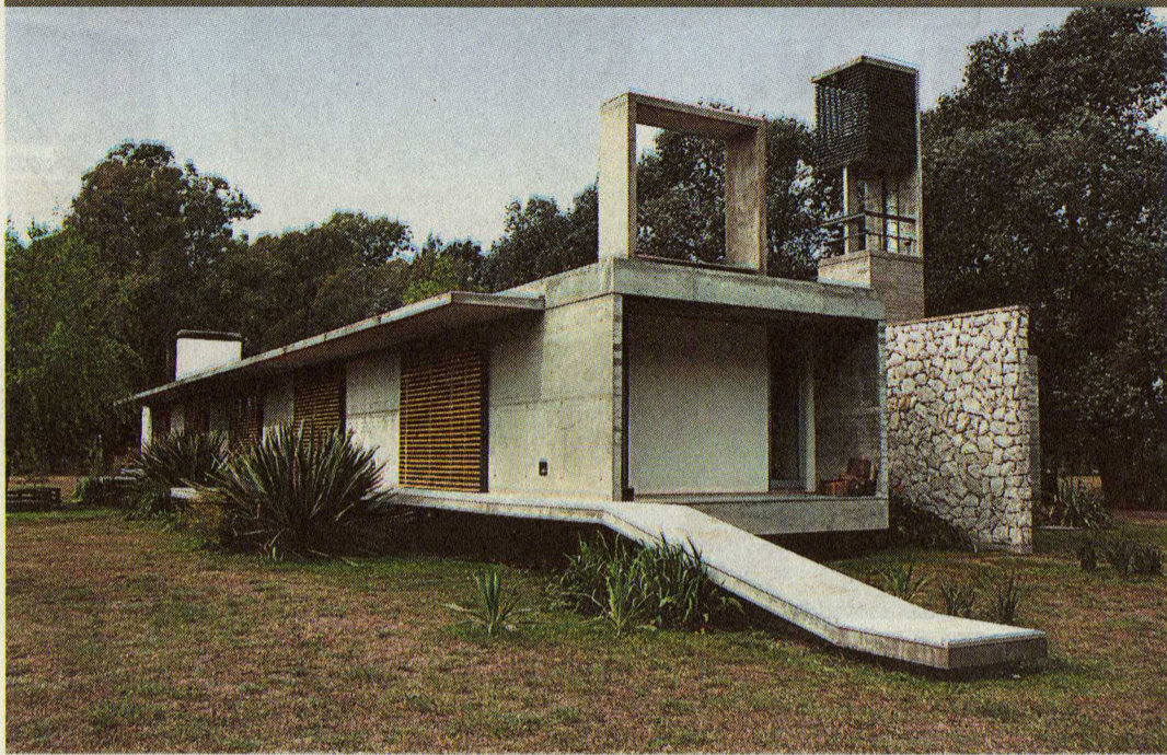
Casa en Cardales. Recibió una mención por su aporte al modernismo con un aire de casa de campo.