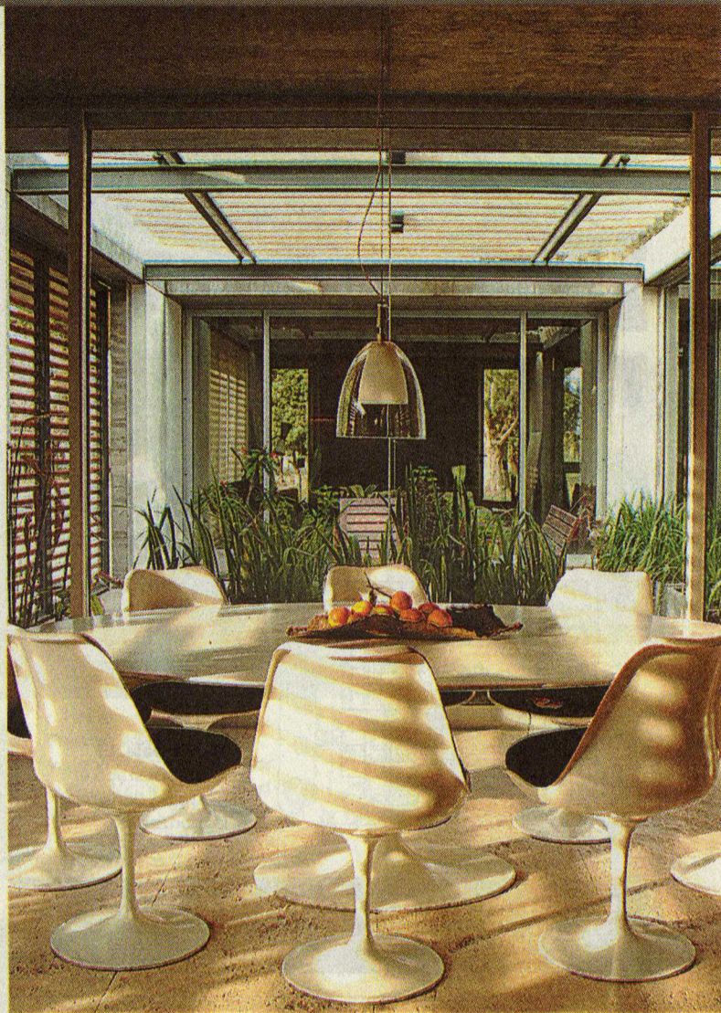
Juego de luz. Una caja de hormigón con "pantallas" de madera.