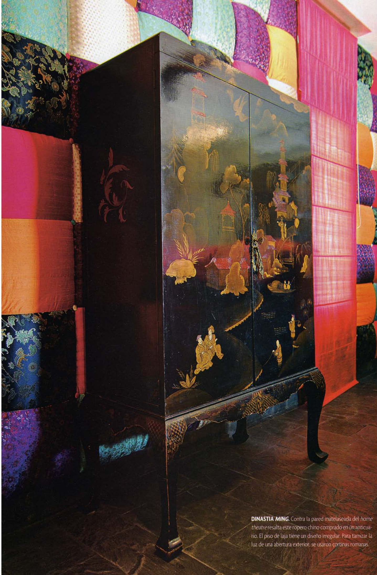
DINASTIA MING. Contra la pared matelaseada del home theatre resalta este ropero chino comprado en un anticuario. El piso de laja tiene un diseño irregular. Para tamizar la luz de una abertura exterior, se usaron cortinas romanas.