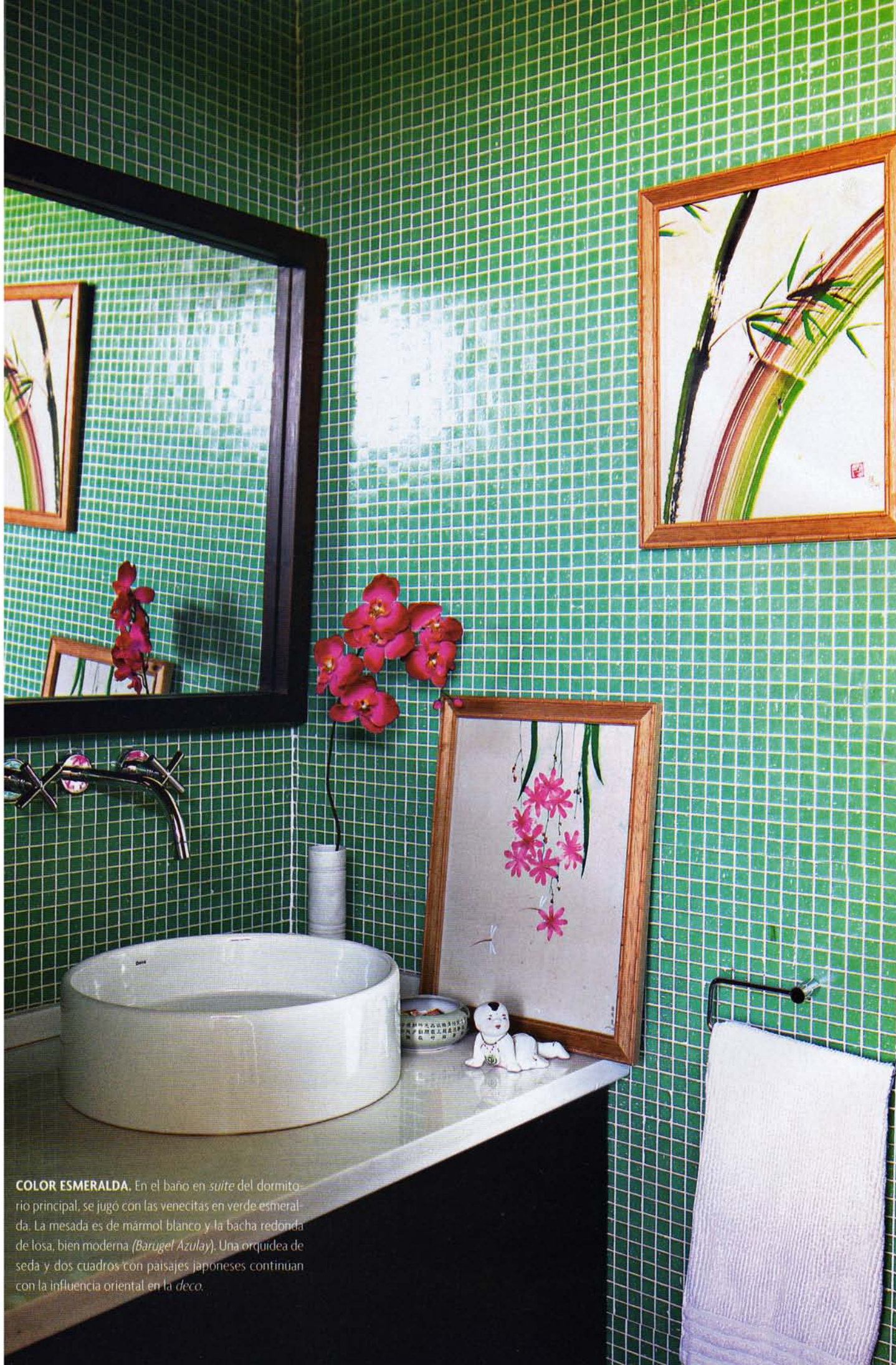
COLOR ESMERALDA. En el baño en suite del dormitorio principal, se jugó con las venecitas en verde esmeralda. La mesada es de mármol blanco y la bacia redonda de losa, bien moderna ( Barugel Azulay ). Una orquidea de seda y dos cuadros con paisajes japoneses continúan con la influencia oriental en la deco .