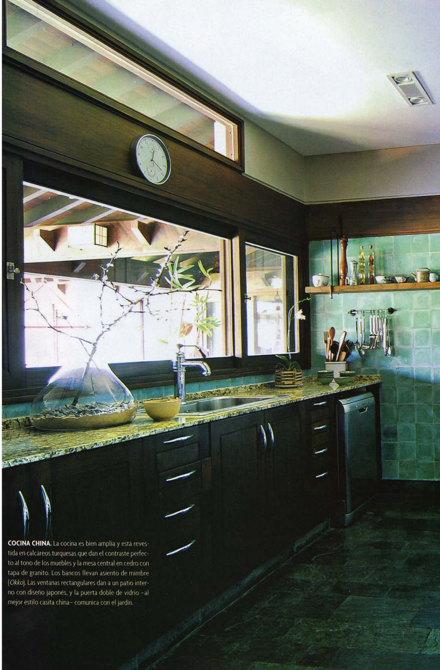
COCINA CHINA. La cocina es bien amplia y está revestida en calcáreos turquesas que dan el contraste perfecto al tono de los muebles y la mesa central en cedro con tapa de granito. Los bancos llevan asiento de mimbre ( Okko ). Las ventanas rectangulares dan a un patio interno con diseño japonés, y la puerta doble de vidrio –al mejor estilo casita china– comunica con el jardín.